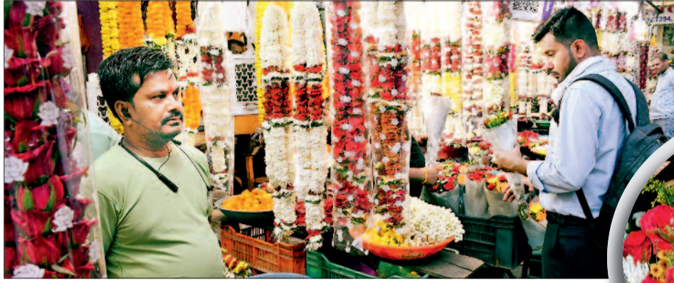
लोटस विद गुलाब वरमाला दूल्हा-दुल्हन की पहली पसंद