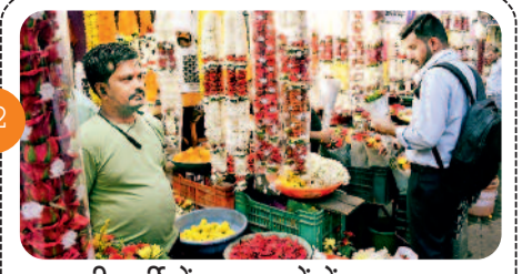
शादी-पार्टी में सजावट में गोंदा-गुलाब ...